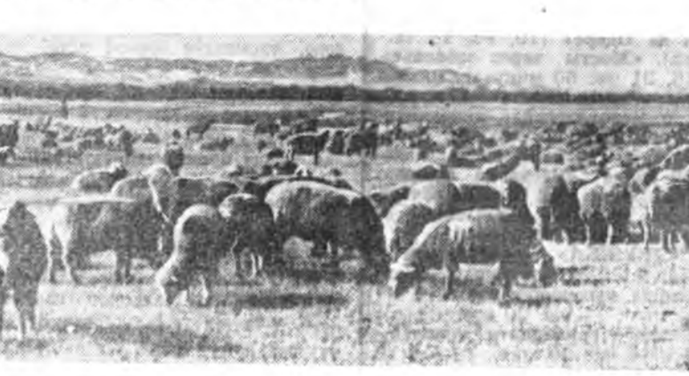
БОРЬБӨГӨН ЭЛДИН ТАЛАДА.

Монгол оройн айлшад манай Зэдын аймагта зоржо ерэхэдэ, колхоз, совхозуударнай яажа, хүдөө ажахын хүгжэлтөөр һонирходо. Манай «Мир» колхозто эрхэн хани оройнгоо түлөөлгшэдтэ мал болон таряан амалйингаа хүгжэлтэе зэрүүлдэг гэһэнби. Артелиманай түрүүшүлтэй танилсажа бусдаг. Тингэдэ бидэнэр хүршэ оройнгоо өөһэдын нотогта ябахадашы, хүдөө ажагыгаар һонирхохо юумэмнай олон байдаг шуу. Монголой Сэлэнгийн аймагай сангай ажахынүүдтэ, хүдөө ажахын нэгдэлүүдтэ дүрбэн зуу мянган табан шахуу мал, тэрэнэй 72 процентнь хонид тоологдог. Мал ажалыг хүгжөөһон тулада хэдгээ бүтээгдэжэ байһан юумэнүүд уган эхэ. Гаекаһан недондо Баруун-Бүрөөнэй хүдөө ажахын нэгдэлдэ ний-