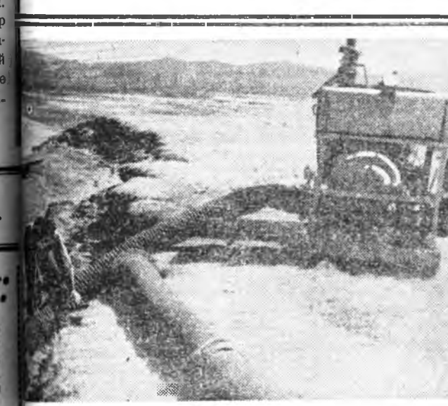
Улан ургасада нэмэри гэжэ зон хэлсэдэг. Тинмэлээ аймагай «50 лет Октября» совхозойндэ энэ үедэ манай бэлшээрнэ шадаһа наа хайнаар уйлаха гэжэ

Энэ партини политикын түлөө, коммунистууд болон хүнүүдэй эдбэршгүгэй нэгдэлэй кандидатуудай үлэ үгэхэ гэжэ «Хамга бүхы юумэ хүнэй нэрэ түрэн- нэ аша тулада» гэһон социализмын агууехэ ёһо гү- нэ дээрнэ хэлбэршгүгээр бэлдүүлхын түлөө дуу- рдахатай.