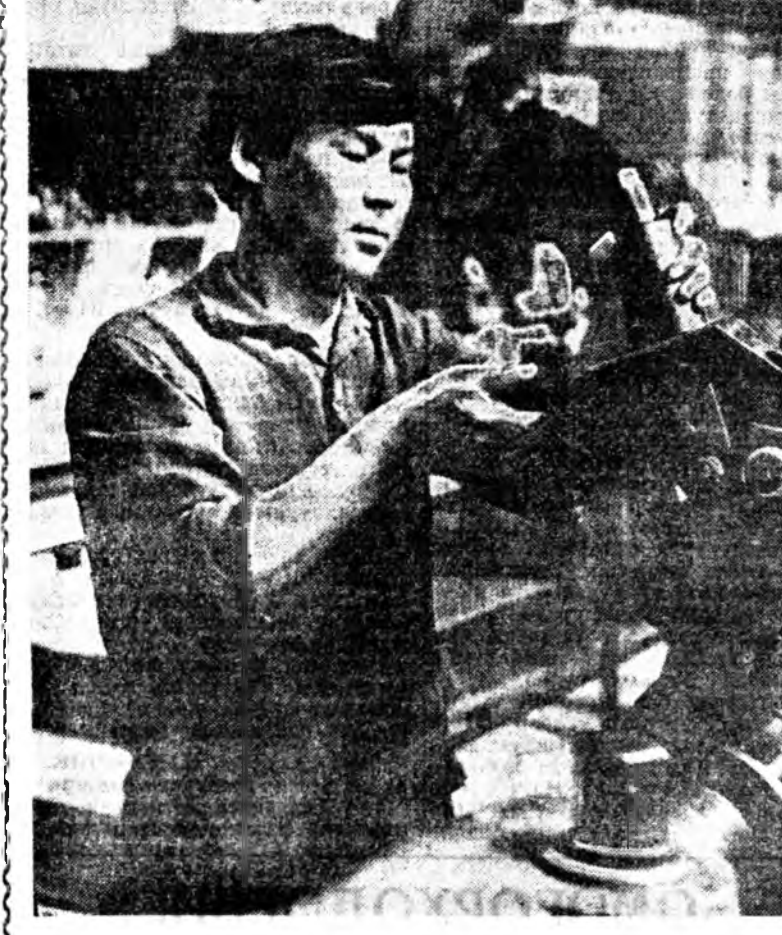
Дизельнэ цех. Моторуудай хүнхнөөн, машинануудай таршаганай таһарнагуй...