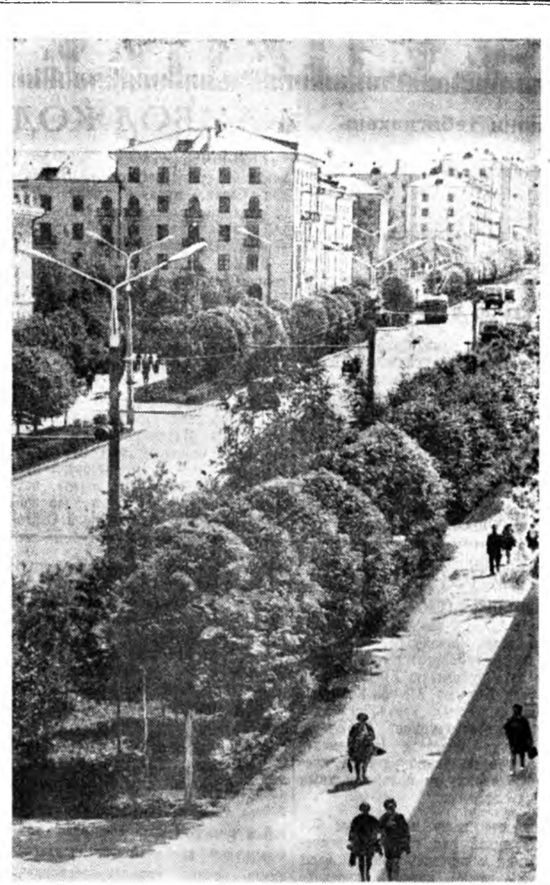
Республикын пинслэл хото — Чебоксарадах Ленинэй нэрэмжэтэ проспект.