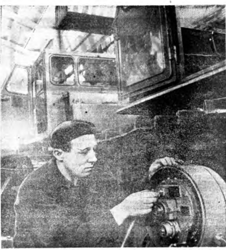
Коложенский нэрэмжэтэ Челябинский харгы заабаарлын заводто «Автопан-1» гэрэн түхэлэй шэнэ бульдозерүүд гаргагдажа эхилээ. Тэдэнэй ашаар газар малтаха хүндэ хүшэр ажал онгойгооруулагдахаа гадна, нимэ машинануудые жолоодоходо тааруу зохи байна.

БУРЯДАЙ АССР-ЭЙ ВЕРХОВНО СОВЕДИН ТҮСЭБЛЭЛГЭ-БЮДЖЕТНЭ КОМИССИИНЫ ТҮРҮҮЛЭГШЭ ТУХАЙ Бурядай Автономито Совет Социалис Республикын Верховно Советэй тогтоохон.