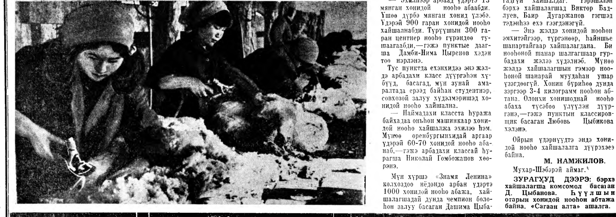
даны хониды хааха хайн сарай бин. Эхилээр арбаад үдэртэ 13 минган хонидой нооно абаади...