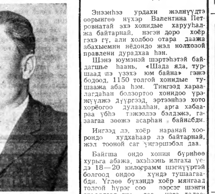
Борьёгой совхозой бүхэдөө 100 хонин бүриһөө 100 хурьга түлжүүлэн тухай хурга суу республика доторнай энэ хабар салхана турһор тараһан бэлэй. Энэл ажахын хонихо бүлгээр—Сви́тунговтон үнэгэрн жэлэһнээ үрэ дүн согсолхо зуураа, ерэхэ жэлэһнээ хараа түсүүбэй бодомжолоо байна.

Хэһэйшэ мэлхээр, ургаса таряал хониды үбэ ноогоной өмнөтэй түрүүшэй—нимэ хэсүү үбэлжэлтэй хонихондоо түгээ бэлдэлтэйгээр утгага гэжэ шиндэжэ, Илнчэй ойн барай жалдэ тэдэрэн бүри дээршэ үбэлжэлтэй социализм үгэлгэ абад, ажал хэрэгтэ хаа ороо бэлэй.