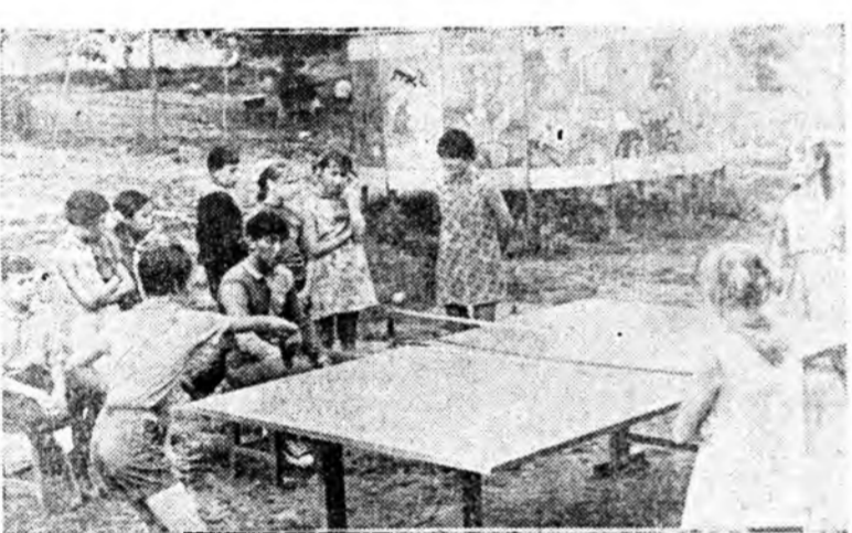
Шамбай бэрхэ спортсменүүдше олон.