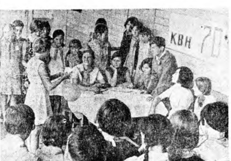
Хэр зэргэ ухаансар нүбэлгэн байханаа үхиүүд туршалсана.

Үдэртөө наран игаа- жа, харуул сэлмэг бай- башье, үдэш үлгөөгүүр сэлгэн дагма хуран, даарама боломо захалаа. Зунай нүүл харын гара- халаар намарай амисхаал бүришье элээр үзэгдэнэ. Бидэнэй «Солнечный» гэж нэртэй пионернүүдэй лагерята хүрэмж ер- хэдэмнай дулаан үдэр- нүүдэй ошомо байха- нимнь бүришье эли- нэн.