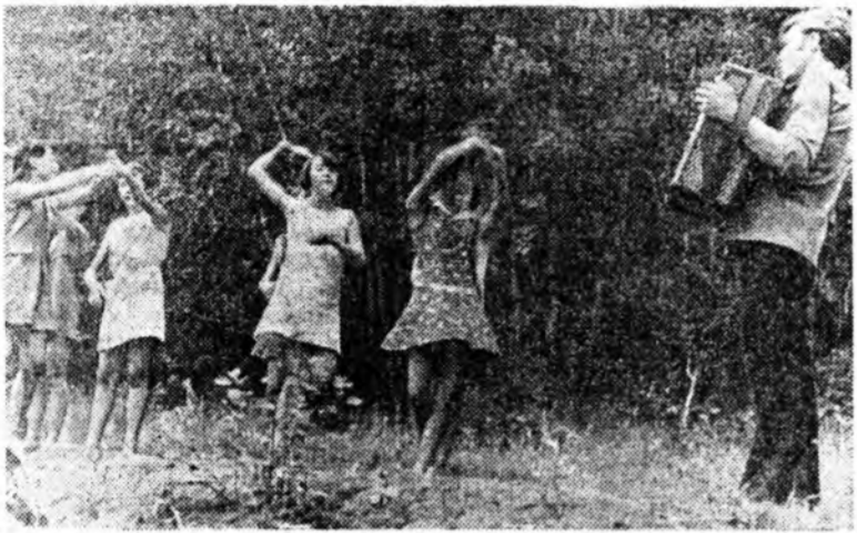
Нэгэдэхи отрядийхид хатар наадаанда хурана.