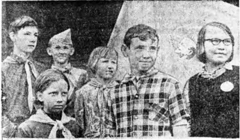
Жэмэс суглуулага шалгархан үхиүүд Улаан тугай дэргэдэ.