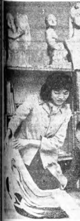
Эрдэмтын ажалда онсо өөрн...