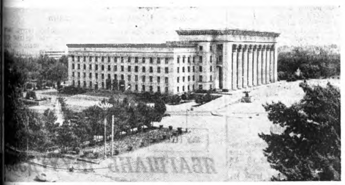
АЛМА-АТА. Казахстанай Компартийн ЦК-гай, Министрүүдэй Сөведэй байшан.