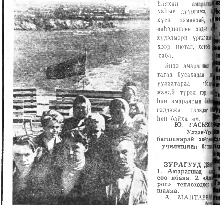
ЗУРАГУУД ДЭМ: 1. Амаралтад зохионоорууд соо яаганда. 2. «Амаралта» теплохондор шална.

Тэршөөлэн энэ амаралтад өөһөдхонго хүсөөр уран найха-най бүтгэм эмхидхэжэ, сугтаа амаралтадаа концерт харуудга-р юм. Жэжээн, найшаг энэ амар-һан «Электромашина» заводой худалмэришэн Лидия Ведерико-ва, Мухар-Шэбэрэй Шаралдай но-