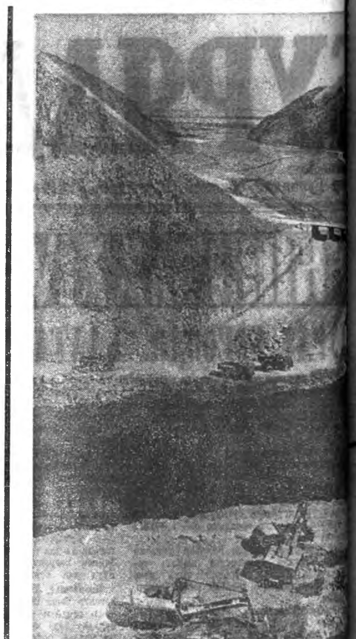
КИРГИЗЭН ССР. Дунда Азидахи эгээл төмөр нилишин барилга Талас мүрэн дээрэ үргэлжлэһэн ашаглалта оруулагдаха хэдэн арбаад мянган зар унаха арга олдохо юм. ЗУРАГ ДЭЭРЭ: барилгын юрэнхэ түхэл.