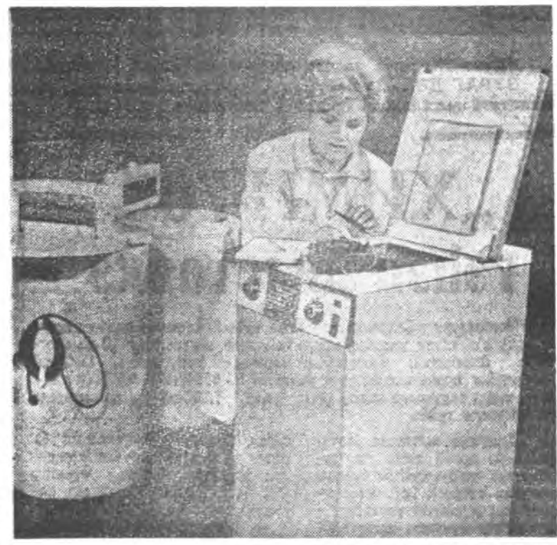
Ажаһуудалай прибор, машина зоёбогдог Киевэй научно-шэнжэлгшэд институтдай хүдэлмэрилэгшэд «СМА-4» гэдэг хубсаһаа угаадаг машина зоёһон гаргаба.