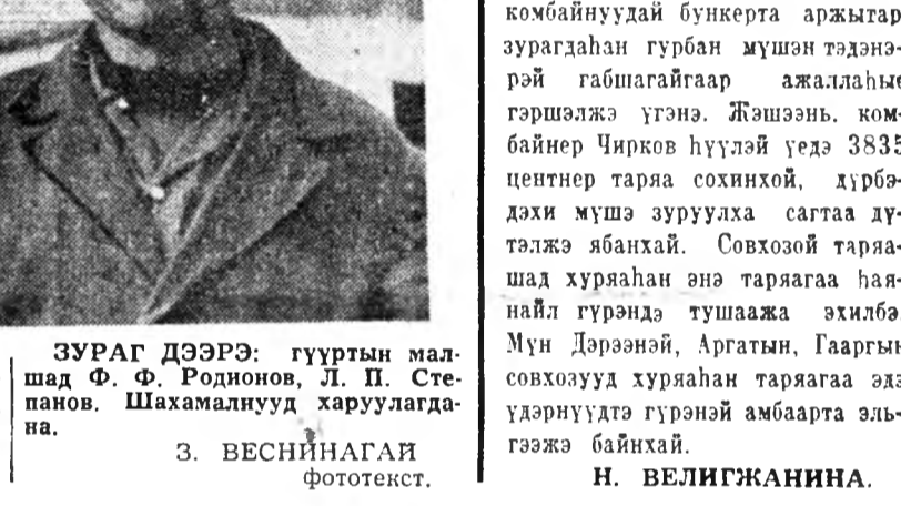
ЗУРАГ ДЭЭРЭ: гүүртн мал- шин XXIV съездые ажалай эр- хим бэлгээр угтахэ зорилго ур- даа табдаг, габшагайгаар хүдэлжэ байнхай.

Малшад шахамалуудайнгаа шэгнүүрэй нэгэ хара соо 24 цент- нерээр нэмэхэ зорилготой. Тин- гэжэ хашараг бүхэнэй шэгнүүр 3 центнертэ хүргэгдэхөөр хара- ладана.