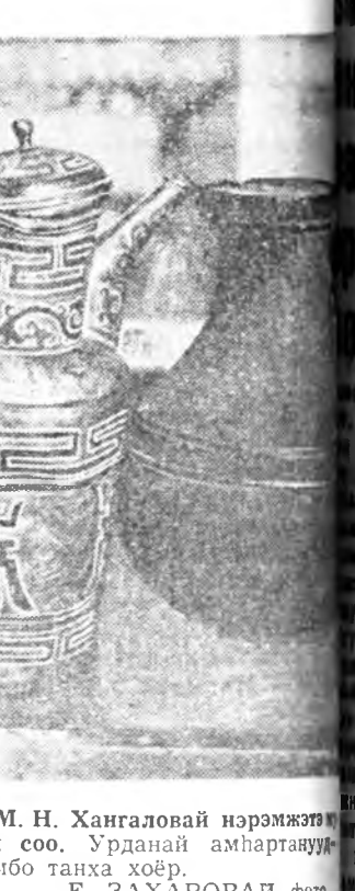
М. Н. Хангаловой нэрэмжтэй зей соо...

Улаан-Удэһөө гараһан ута боро автобус уудам талаар шуумайһан аба- на. Автобус соо хүн зон олон.