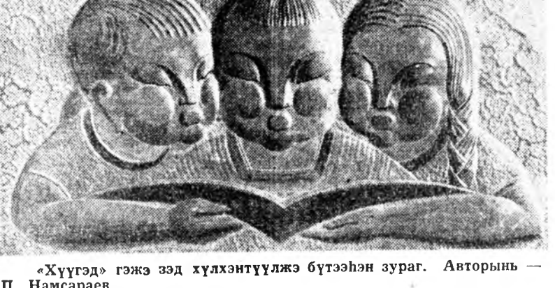
«Хүүгэдэ гэжэ эд хүлхэнүүдэ бүтээн зураг. Авторын — П. Намсарев»