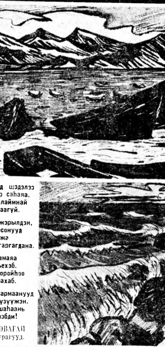
ШОГ ЁГТО МУРҮУД

наараа байһан ажал хэжэ адханаан хүлгээ хосорохогүй гөбөл ала-һан тэхингээ толгой тайража, хайрсаг соо хээд, гэрэйнгээ хойно байһан нарһанай үзүүрта газар малтажа, аятайханаар хадагалла-райтай! Гурбан жэл соо тэсэбэри-тэй хүлгээгэд, хайрсага нэрхэдэ-тай, нэгэл ушартай байха.