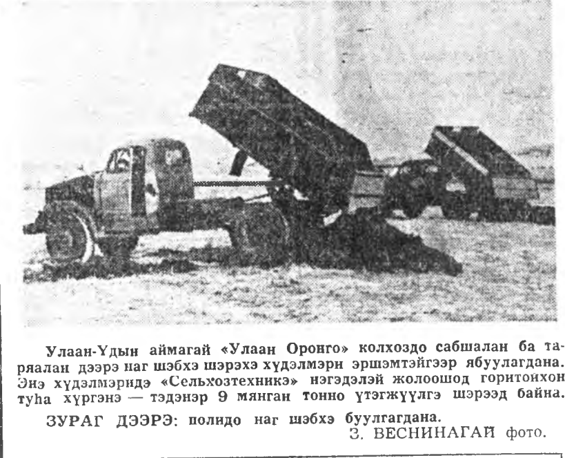
Улаан-Удын аймагай «Улаан Оронго» колхоздо сабшалан ба тарьяалан дээрэ наг шэбхэ шэрэхэ хүдэлмэри эршэмтэйгээр ябуулагдана. Энэ хүдэлмэриде «Сельхозтехника» нэгдэлэй жолоосод горитонхон туһа хүргэнэ — тэдэнэр 9 мянган тоно үтэгжүүлгэ шэрээд байна.

ЗУРАГ ДЭЭРЭ: полидо наг шэбхэ буулагдаана.