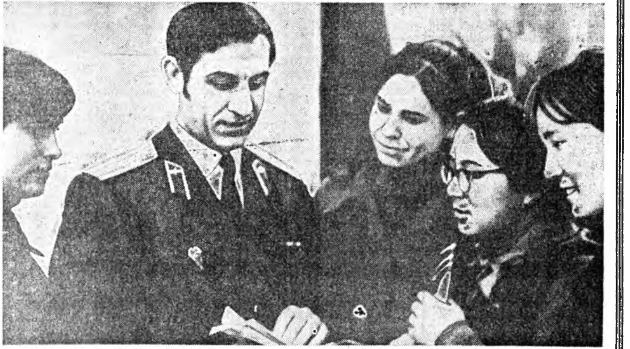
Буряадай Гүрэнэй филармонин эстрадна концерт Эрхирээй совхозой Арбижал нууринда ажануушадыг ехэтэ байрлуула.