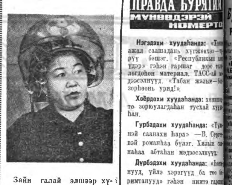
Зайн галай элшээр хүдэлдэг оньхожоруулагдамал аппаратдай хүсөөр үнэбэ буржылгуула.