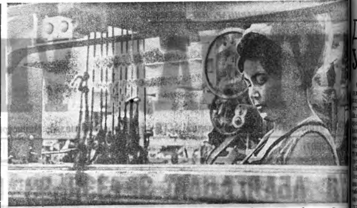
Улаан-Удын нарин сэмбын фабрикан хүдэлмэришэд болон алба хаагшад табан жэлэйгээ түсөөбөө хубилжа даабариене үшөө нүүнэ харда дүүргээ хэв. Мүнөө нүхэр Земцова нарин нартэй сэмбэ нэхэжэ, халаан бүрингөө даабари 115 процент хүрэтэр дүүргэнэ.

В. КОРЯКОВЦЕВ, Эдын комбинатай ажалай болон сални хүлгэнэй таһагай начальнигай орлогшо.