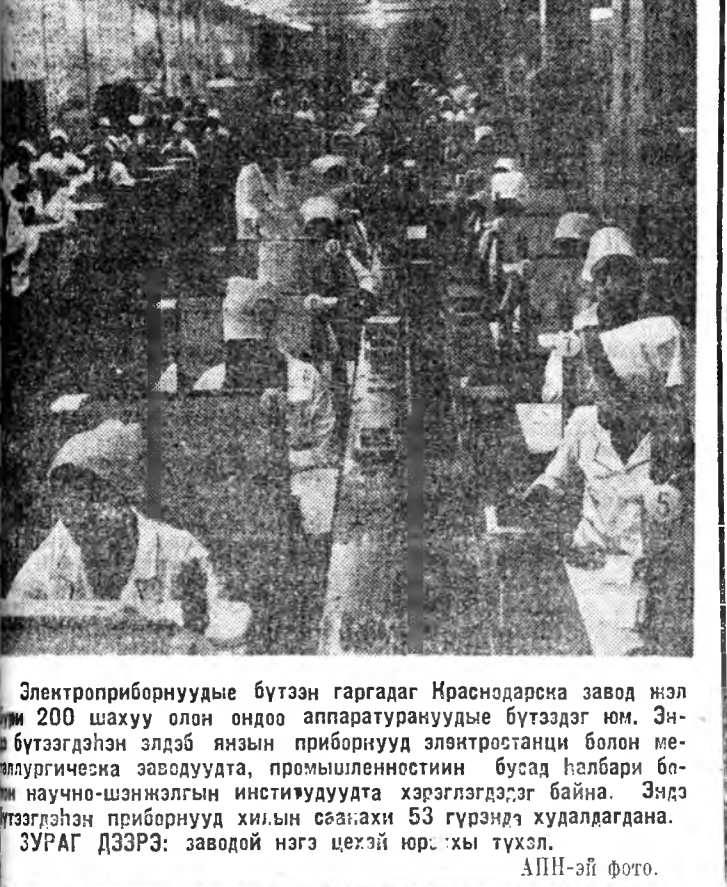
Электробиорнууды бүтээн гаргаад Красноярскы завод нэлэ...

ЭСЭГЭ ОРОНОО ХАМГААЛАГШАДТА. УЗЛОВАЯ. (Тульская область).