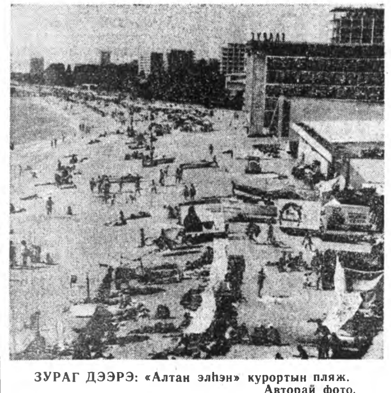
ЗУРАГ ДЭЭРЭ: «Алтан элэн» курортны пляж.

(Түгэсхэл. Эхнийнн декабрин 15-най номerto).