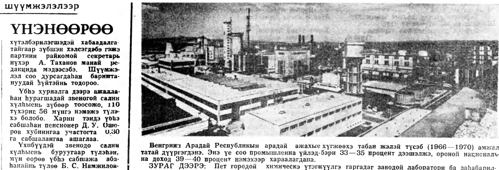
Венгриил Арадай Республикын арадай аажмэ хөгжөөжэ табан жэлэй түсэб (1966—1970) амжал...