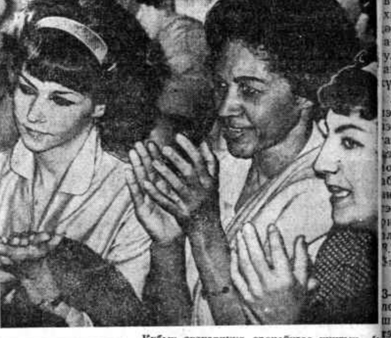
КУБЫН РЕВОЛЮЦИОН ОЙДО Кубын эхэнэрүүд оройнойгоо нингэн ба ажал худалмэрини ажабайдалда эдэбхитэйгээр хабарадана. Олон эхэнэрүүд дээр тушаалта худалмэридэ дэбжүүлэгдэнэ. Тэдэр соёл газарал хүгжөөхэ хэрэгтэ, үхибүүдэй яслинууде ба саадууде олошооруулаха абадалда горитохон хубитана оруулаа. ЗУРАГ ДЭЭРЭ: Кубын эхэнэрүүд ажалгайгаа хүүлээр концерт харана.