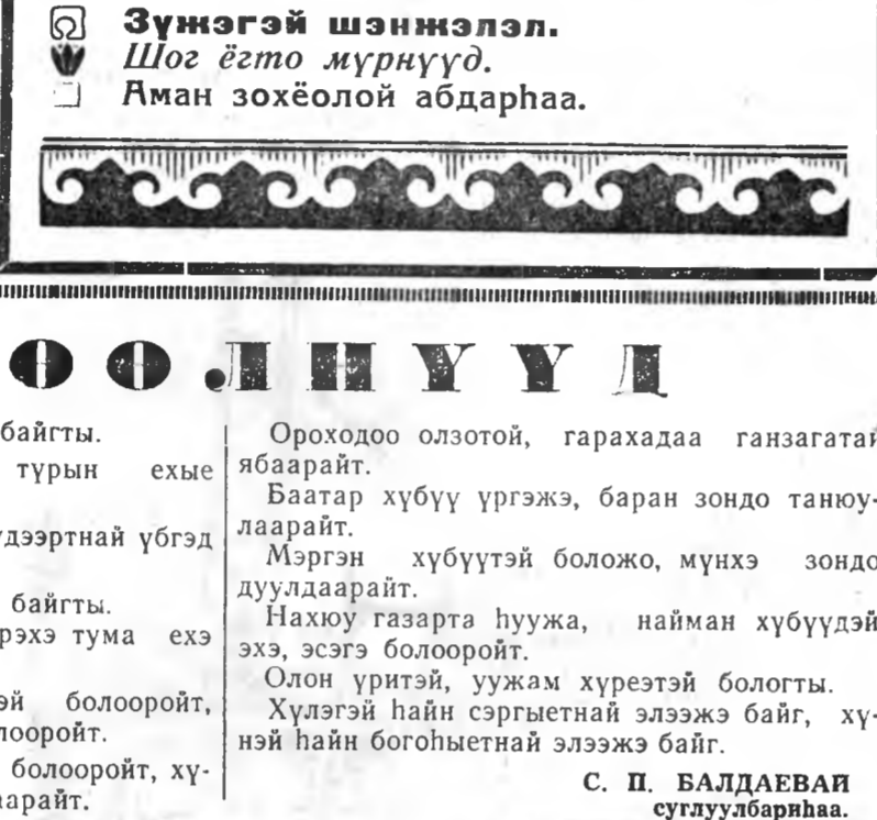
Шэнэ жэлэй ёлго.