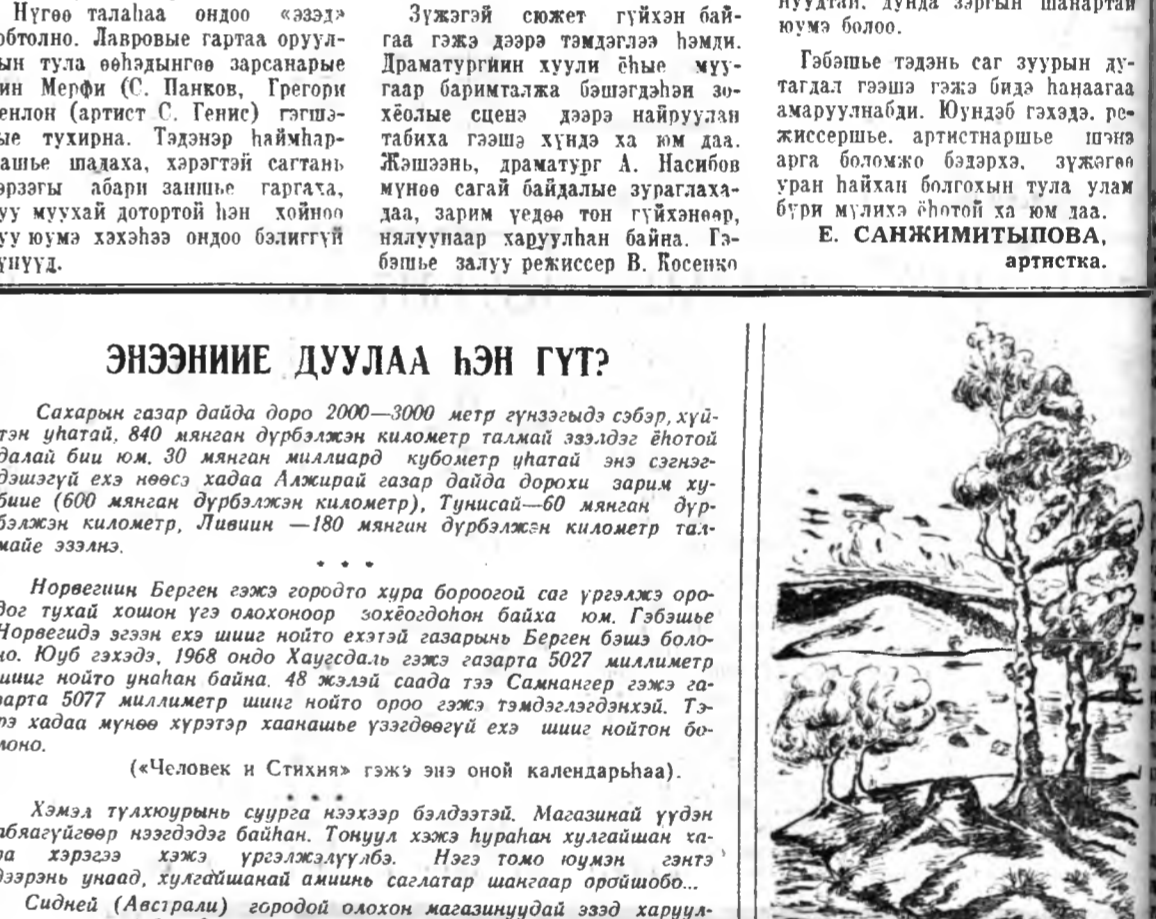
«ЭЖЭЛ ХУҮАД». В. БАДМАЕВАГАЙ зураг.