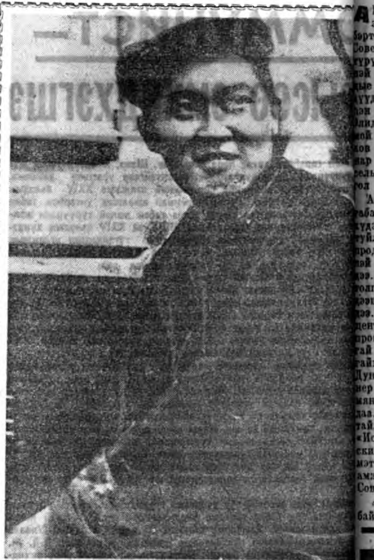
Түмэр хэрэгсэл бүтээдэг Улаан-Удын Кировой жэжэтэ заводой хүдэлмэришэд болон алба хаагсад угтарһан бан жэлэйнгэ тусбэ ноёрһин 30-да дүүргэжэ һэн. Мүнөө заводонхид шэнэ табан жэлэй 10 хоногой даабари графий уридшалан дүүргэбэ.