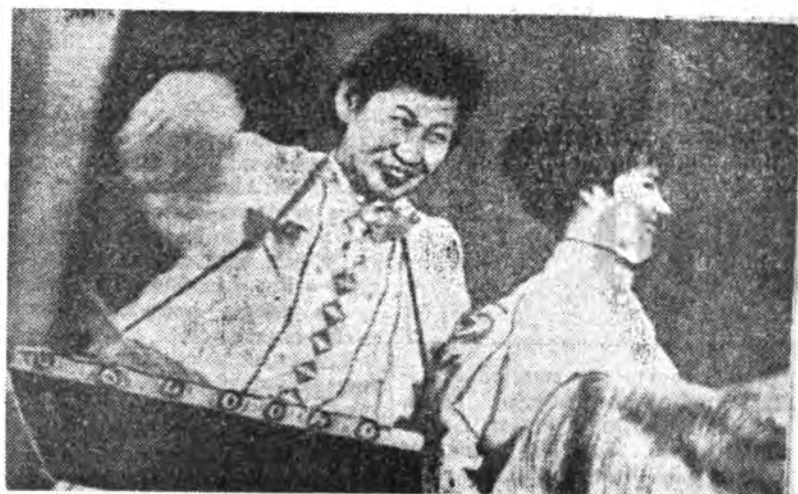
Улаан-Удын промышленна предприти, эмхи зургаануудай уран хайханай бүлгэмүүдэй харгалзан үнэгэрэн субботодо эхилбэ. Энэ харалгада городской медицинь эмхи зургаануудай худалмэрилгэсэд зэбхитэйгээр хабаадасана. Республиканска больницын худалмэрилгэсэдэй уран хайханай бүлгэмүүдэй олон ондоо номеруудые уран хайханаар гүйсэдхэжэ, жюриин хайн сэгнээтэдэ хүртээн байна.