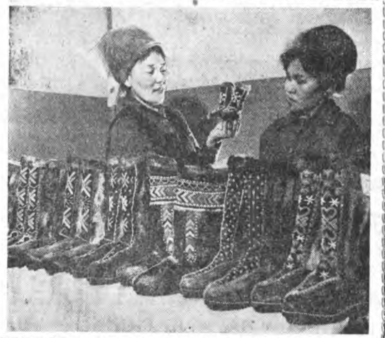
Иигэжэ зомнай хайн хүнише хүндэлбэ, аша туйһень харуулаба.