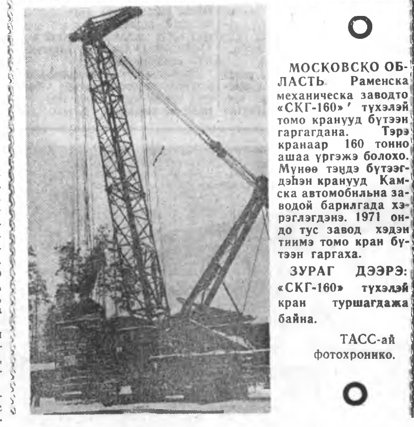
МОСКОВСКО ОБ- ЛАСТЬ. Раменскэ механичкеска заводто «СКГ-160» түхэлэй томо кранууд бүтээн гаргагдана. Тэрэ крануар 160 тонно ашаа үргэжэ болохо. Мүнөө гэдэ бүтээг- дэһэн кранууд Кам- ска автомобильна за- водой барилдаа хэр- гэлгэдэнэ. 1971 ондо тус завод хэдэн тиймсэ томо кран бү- тээн гаргах. ЗУРАГ ДЭЭРЭ: «СКГ-160» түхэлэй кран туршагдажа байна.