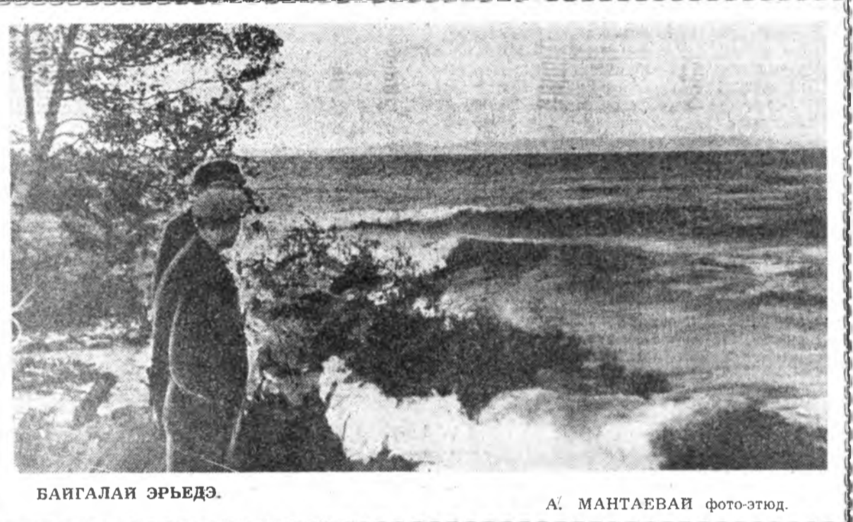
БАЙГАЛАЙ ЭРБЕДЭ. А. МАНТАЕВАН фото-этид.

Аба, Эжи, дүү Тыуана, амар мада! Бэсэгүтэй абааб.