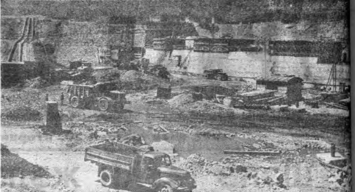
КПСС-эй XXIV съездын шийдхэбэри—олонитэдэ