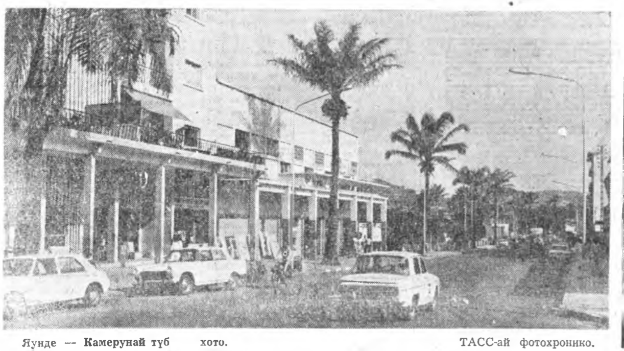
Янде — Камерунай түб хото.

г. УЛААН-ҮДЭ, ул. Ленина, 35. Телефоны: редакция — 54-83, зам. редактора — 68-08, зам. редактора — 62-62, ответ. секретаря — 50-52, зам. ответ. секретаря — 63-86, проваганда и агитация — 56-23, промышленное строительство — 61-35, советского строительства в культуре и школе — 60-21, писем и рассылки корреспонденции — 34-05, общественная приемная — 56-82, бюро — 57-63, фотолаборатория — 33-61.