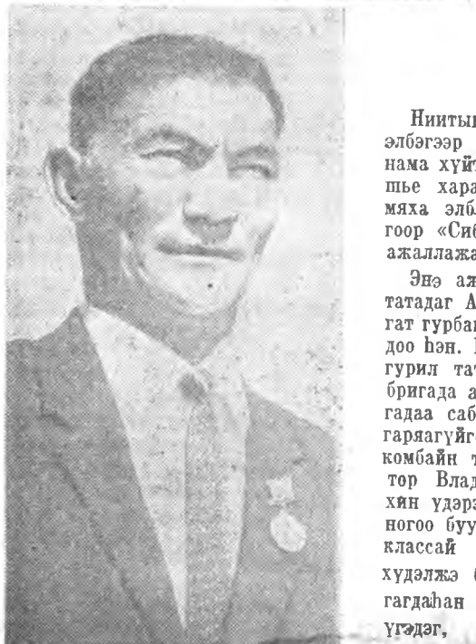
Зуун тонно бэлэдхэгдээ

Эдэ бүгэдэн ашаар сагай ула-рилай хэды таармажагүй байба-ны наань, мүнөө бүхэ дээрнэ 8 мянга шахуу центнер үбнэ хү-рилжэ абаабди. Тэрэнхэ гадна, гурбан багхан хүндэ 90 тонно сенаж дарагала, 80 центнер ви-таминтай ногоон үбнэ бэлэдхэг-дээ, 1000 центнер модо, бурга-надай могоон найса намаа хура-лагдажа хатагдаа, хадгалдаа.