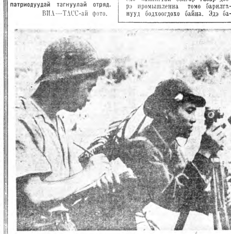
Урда Вьетнамай арадай зоб- сэгтэ хүсэнүүд американ-сайго- ной сэргэшэдтэ хатуу шанга со- хилто үгэнэ. Һүүлэй хэдэн һа- рын туршада хархис этгээдүүд олон сэргэшэдэ алдаа.

ЗУРАГ ДЭЭРЭ: Урда Вьетнамай патриодуудай тагнуулай отряд.