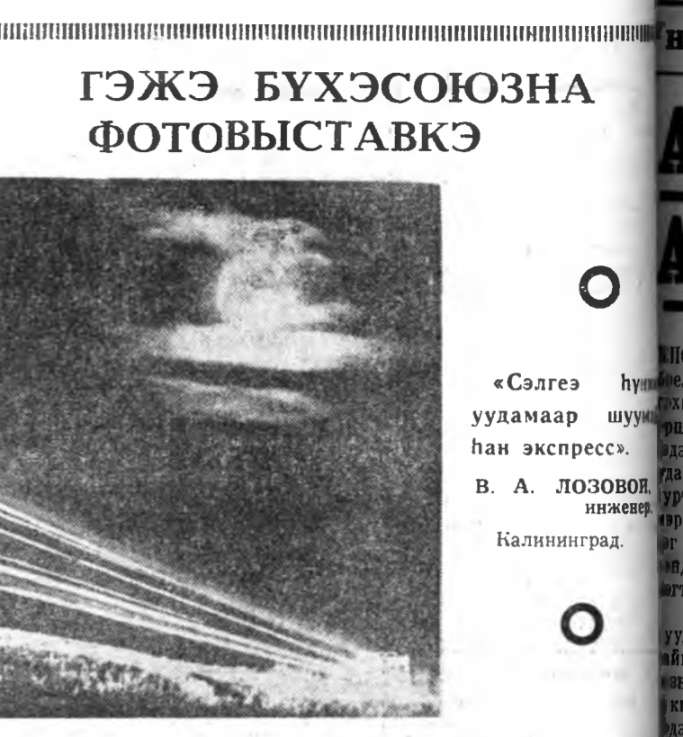
ГЭЖЭ БҮХЭСОЮЗНА ФОТОВЫСТАВКЭ