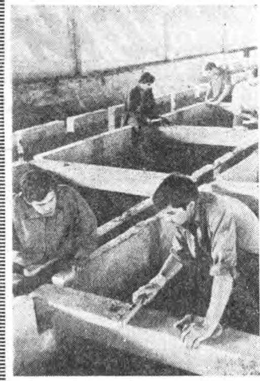
ТҮМЭР ЗАМАН ТРАНСПОРТЫН инженерүүдье хургага гаргадаг Москвадахи институтад студентвэр зунһаа амаралтын үдэ худөө гаража, колхоз, совхозууд та ехэ туһа хүргэдэг заншалтай юм. Байгша ондо тэдэ Москва шадарай мал шахангаргалуулын «Вороново» гэжэ совхоздо байһан гэр, малай байра бариха байхтай. ЗУРАГ ДЭЭРЭ: хабсаралтын хүдэлмэри хэгдэнэ.