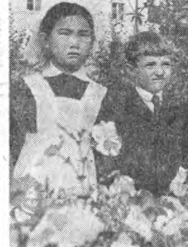
«Баяртай, түрэл сааднай! Мэндэ амар, нуруули!» гэжэ томоор бөшөгдөөн үгэнүүд ханада аржына. В. И. Ленин багшын томо дүр доро хангалтама сэгсүүдэй баглануудые тэбэриһэн хүүгэд жагсаана.

Энэ юуб гэгбэл, Улаан-Удэ хотын «Теремок» гэһэн нэрэртэй (№ 56) ясли-садта хүүгэдые