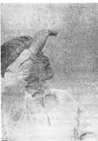
«ЛЕТЧИК БОЛОО, БАА ЯМАР, ХАБИ?»

Тинхэ зуураа Кабанскын совхоздо, Исток, Красный Яр, Шергино, Байгал-Худара нууригуудай соёлой байшан соо, нү хаалин ба гахайн ферменүүд, цолевый станууд дээрэ концерт табинаа, лекци уншаан байна.