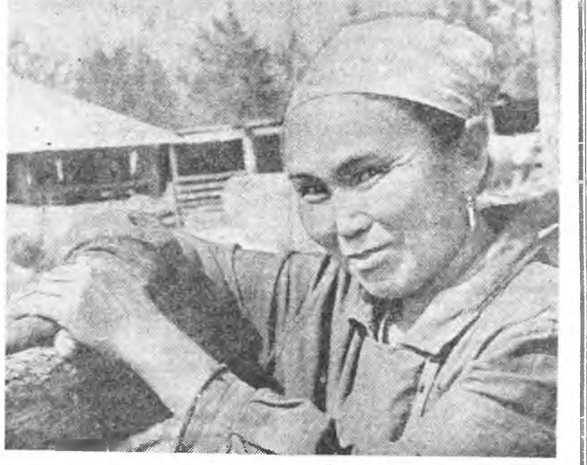
Энэ зураг дээрэ Сэлэнгын аймагай «Эрдэм»...