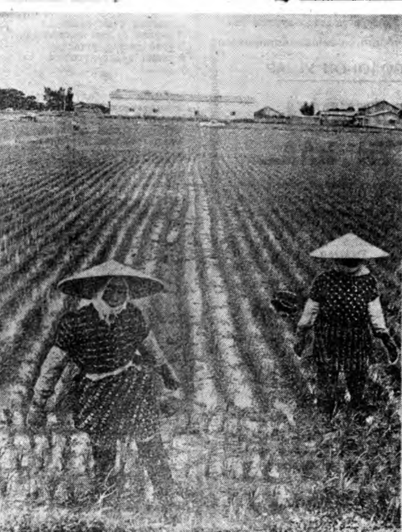
Япондо харын туршада бороо хура оройной һүүлээр сэлмэг үндэрүүд тогтожо эхилбэ. Хүдөө ажахын ажалшад өөһөднгөө по-лицинууд дээрэ сүлөөгүй хүдэлмэрилхэ үе сагынь эрээ. ЗУРАГ ДЭЭРЭ: ажалшад барайгарай поли дээрэ үбһе ногоо түгжэ байна.

БОНИ. (ТАСС). ФРГ-гэй Обороннын министрствын захиралта тухай гажэ зетэнууд мэдэсэһн. Тэрэнэй ёноор, Баруун Германиян далайн-сэргэй хүсүнүүдэй корабльнууд ГДР-эй түг дор далайгаар тамаржа айбан корабльнууд болон худалдаа най-