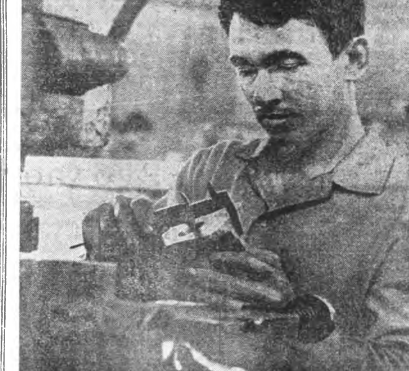
ТАБАН ЖЭЛЭН даабари болзрооһон урьд дүүргэжэ гэгэн зорилго «Теплоприво» заводой худалдаришад урдаа табдаг...