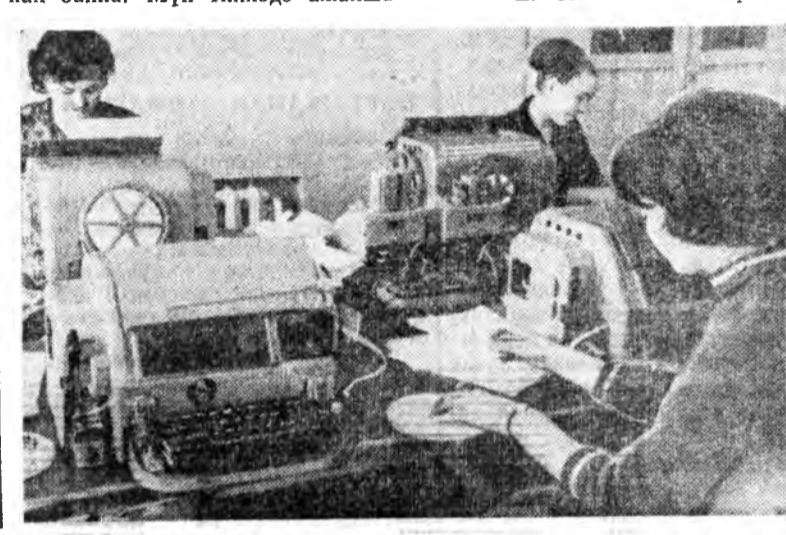
Ушарын юуб гэхэдэ, нотаг бүх-н шэжэ гэр байрн, нингын эмхи-нүүдэй барилга үргэжэжэ байнх.