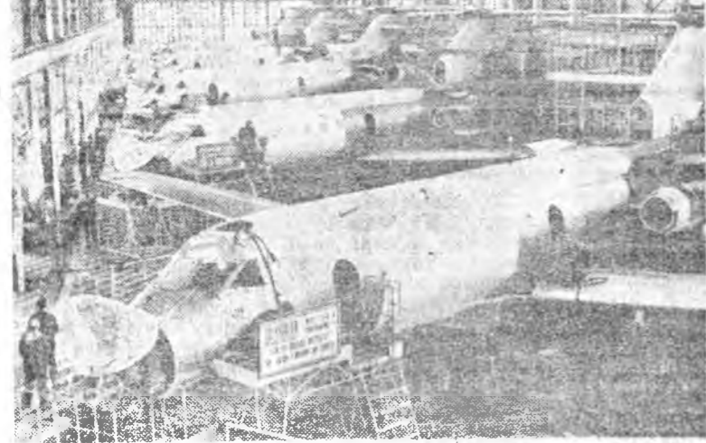
СССР-эй гражданска авиациин «ИЛ-14» түхэлэй самолёдыг халай нэлгэжэ байһан «ЯК-0» түхэлэй самолёдууд Саратовэй авиацино заводто бүтээгдэжэ юм. Аэрофлотой парк нээгэжэ байһан агаарй онгоцо 27 хүнэй хууритай.