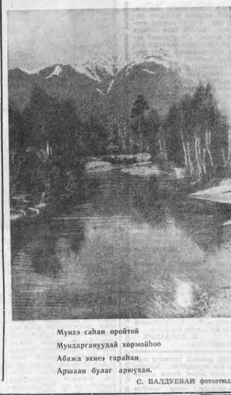
С. БАЛДУЕВАН ФОТОЗТӨД.

«Һула табихан нур...» Архын хотгуугай алмай ябадал, аюултай муухай харгы тухай элдэ олон юумэ хэлбэлшнэйшэ улоо ха даа. Энэмнай, — юрлөөдэ доосоо зааханшье солоохойтой хүн бүхэндэ мэдээжэ ха юм. Бодоошье үзэл даа, Архнаал боложо, хэдэ олон айл бүлэ наһан наһандан, үрн хүүгэднэй үшнэрнэ гэһэбш? «Хатуу хары» хэдэй үдэрөөр наһаад ябадаг хүнүүдлээ боложо, айл тухай ехэ амал хүдэлгэри наһана, намшаа, гүрнүднэй хэдэ ехэ гэрээ хохилд болоноб. Зариман мэдээ ухаа алдтарана архи залгаад, аюу томоһини гү, али тракторай жо-тороо баржа, хумхарһан юумэлд гүйлгэдэжэ, өөргөө гэмтээхэ хэдэй наана, ямаршье гэм зэмэгүй хүнүүдтэ аюул ушаруудад байна бшуу. Үнгэржэ эрхэдээ нүүгэ зариман архин хотгуугаар хүн түхлөө алдажа, хэрүүл наһалдаа, хулиган, ээрлэг муухай ааша гаргаха, хутага шүбтэ баржа, дүтэ байһан гү, али урдань дайралдһан хүнэй амы наһанда хоёр хүрдэгдэһи байна.