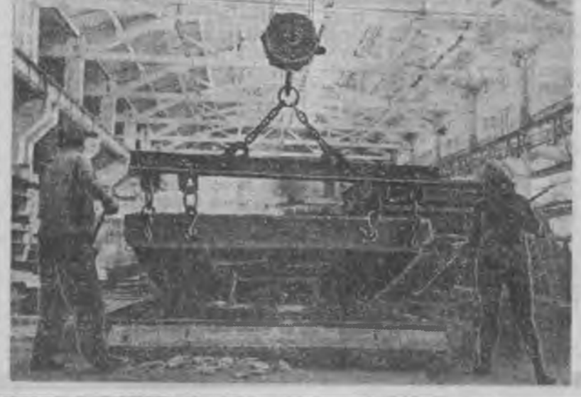
„ЛУНОХОД-1“: һарын табадахи үдэр

К. ЖАМЬЯНОВ. ЗУРАГ ДЭЭРЭ: Бригадир П. И. Соколова. Хүндэ бетоний цех соо.