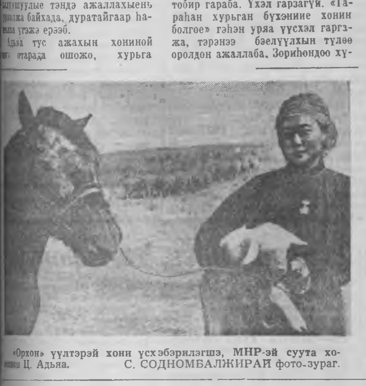
«Орхон» үүлтэрэй хони үсхэбэрилгэлэ, МНР-эй сууга хо-нишон Ц. Адыа.