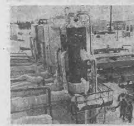
Сыктывкар, ЗУРАГУУД ДЭЭРЭ: Вухтыска газоконденсатна олоборилгын тухээрлгүүд...