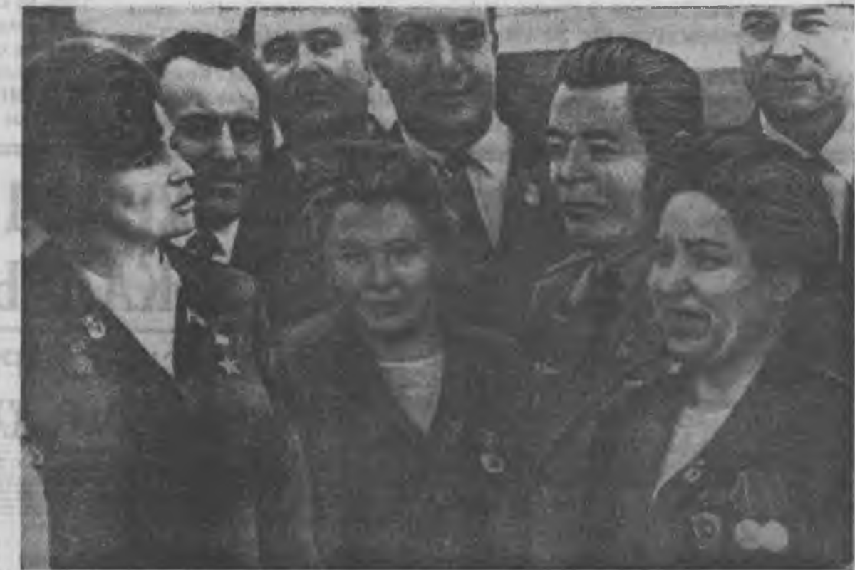
МОСКВА. КПСС-эй ХХIV съезд. ЗУРАГ ДЭЭРЭ: СССР-эй летчик-космонавтууд Советскэ Союдай Герой В. В. Терешкова-Николаева, Советскэ Союдай хоёр дахин Герой авиациин генерал-майор А. Г. Николаев съездийн делегадуудай дунда.

съездые найдуулахынь КПСС-эй ЦК-гай Генеральный секретарь нүхэр Л. И. Брежневэй зүрхэндэ ширээдэ наби гээд Белоруссийн партиин ЦК-гай нэгээхэй секретарь П. М. Машово мэдэсэбэ: сию харуулагдаһан амжалт элдхэл олон тобиһан социалист Эхэ орноос саашадань хуужалдхи коммунист олон миллион хува тийн, тэрэнай Центральный Комитетэй, коммунист дүрбэн сэхэ, зориг туйлаһи дай түлөө оморгоһи соо би болгоно.