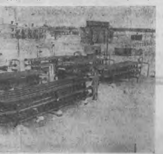
Сыктывкар, ЗУРАГУУД ДЭЭРЭ: Вухтыска газоконденсатна олоборилгын тухээрлгүүд...