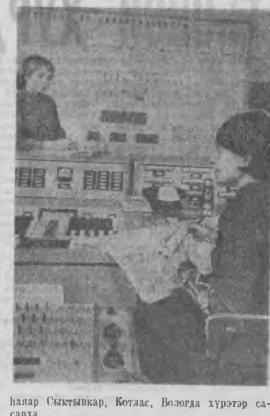
Сыктывкар, ЗУРАГУУД ДЭЭРЭ: Вухтыска газоконденсатна олоборилгын тухээрлгүүд...