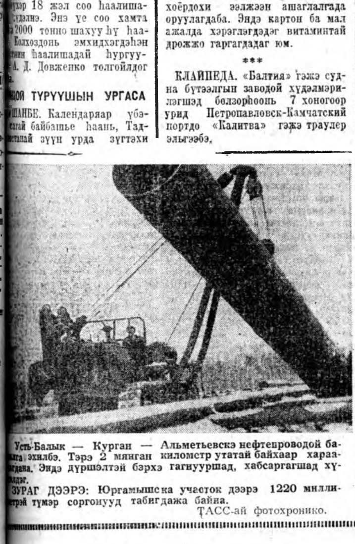
Усть-Балык — Курган — Альметьевск нефтепроводной ба-зата эхилаб. Тэрэ 2 мянган километр утатай байнаар хара-ллага. Эндэ дүршлэлтэй бэрхэ гагуурууд, хабсаргад хү-раага.

КЛАШЕДА. «Балтия» гэжэ суд-на бүтээлгэн заводой худалмэри-лэгнэд болзорбоонь 7 хоногээр уриа Негротапловск-Камчатский портдо «Калитва» гэжэ траулер эльгээбэ.