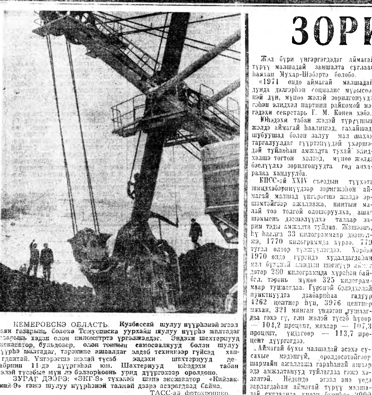
КЕМЕРОВСКОЕ ОБЛАСТЬ. Кузбассей шулуу нүүрэнэй эгээл... КЕМЕРОВСКОЕ ОБЛАСТЬ. Кузбассей шулуу нүүрэнэй эгээл...