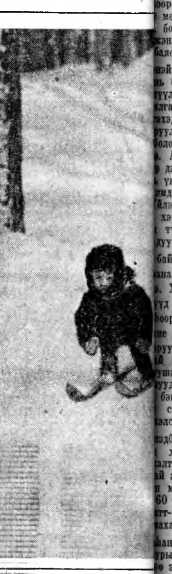
Шэмэрүүн хүйтэн жабарай Шэхэ хасар шэмхээшые хаань, Хадын түргэн ташалан руу Халтиран санаараа доошоо Нарһан тужын дундуур Нииндэнэдэл шуумайнаб.