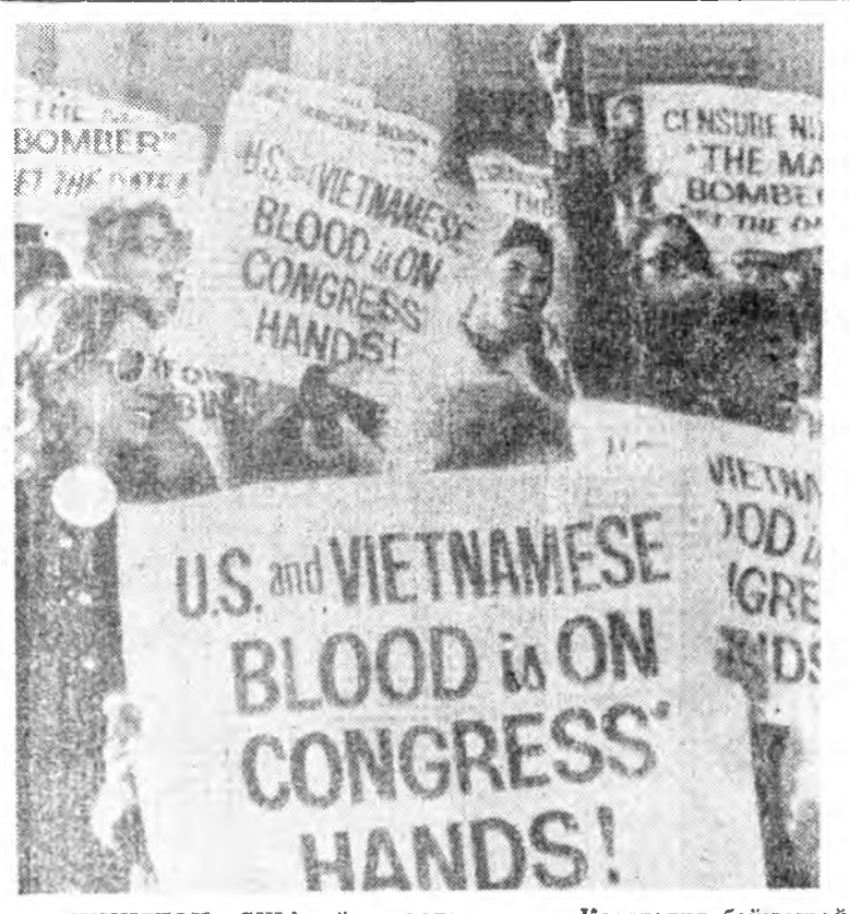
ВАШИНГТОН. США-гай нислэл хотын Капитолия байшангай дээрэ өсөн тэстэ ажалшадтай хабаадалгатай буруушаллын демонстраци үлгэрэгдэ. ЗУРАГ ДЭЭРЭ: демонстрациин үе. ТАСС-ай фотохронико.

Эб найрамдалай Бүхэдэлхэй Советэй президиум бүү зэбсэгүүдые хуралтын асуудалуудаар Бүхэдэлхэй конференци оройн сагта зарлаха гэхэн бодомжые һайшан дамжэб. Финляндийн президент У. Реккөнэн Эб найрамдалай Бүхэдэлхэй Советэй президиумтэй заседанида хабаадагшадтай уулзаа.