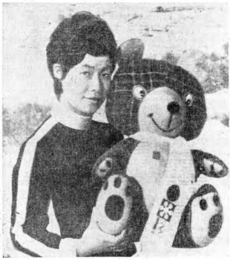
ЗУРАГ ДЭЭРЭ: журналистуудай түбэй байшангай хүдэлмэрилгэшэ олимпийн XI нааданай нүлдэ тэмдэг — нааданхай баабрайтай бай на.

Дүрбэ дахин олимпийн үбэлэй нааданда хабаадалсан манай оройн түлөөлэгшэд Любовь Баранова, Павел Колчин, Евгений Гришин, Лидия Скобликова, Людмила Белоусова, Олег Протопопов, Владимир Меланин, Владимир Белоусов, мүн хоккеистнэр, биатлонистнууд Эхэ ороноо холо ойгуур суурхуулаа бэлэй. Тингэжэ мүнөө орон дотор 68 спортсмен үбэлэй олимпийн нааданай чемпионий нэрэ ээргэ зүүжэ ябана ха юм.