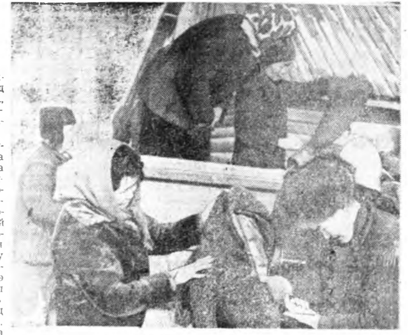
Мянган килограммны чухам тусгай аад, тэрнээ 8100 килограмм дагуу хураангуй хурааж авчирсан Ириний нэгэн хүүхэдүүдэй хамт хураангуй хурааж авчирсан Ириний нэгэн хүүхэдүүдэй хамт...

Энгийн хоньны хоньд гэрэл ороход болохоор байхдаа Орлин гэрэл гэрэлдээ хархын хоёр үрүүлж жорьдлаан хоньд үндэл хада уулагуудын үнийн утгаа Аха нотагаа хоньд мүнөө хажан хана хууналал абия аниргүй гэрэлдээ.