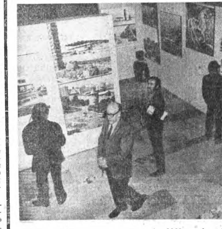
Мехикэдэ, соёлой «Бельяс арте» гэжэ түбтэ СССР-эй урданай ба мүнөөдэй архитектурын памятникнуудай фотоувсгалкэ нээгдэбэ. СССР-эй Мехикэдэхэ посольствын эмхидхэлэн выставкыне мексикан нислэлэй нийтэ сэхэ лонихрон харана. Выставка Мехикын уран гов искусствын национальна институт эмхидхэлэһэн байна.

Г. БОРОВИК, АПН-эй тусхай корр. Сантьяго.