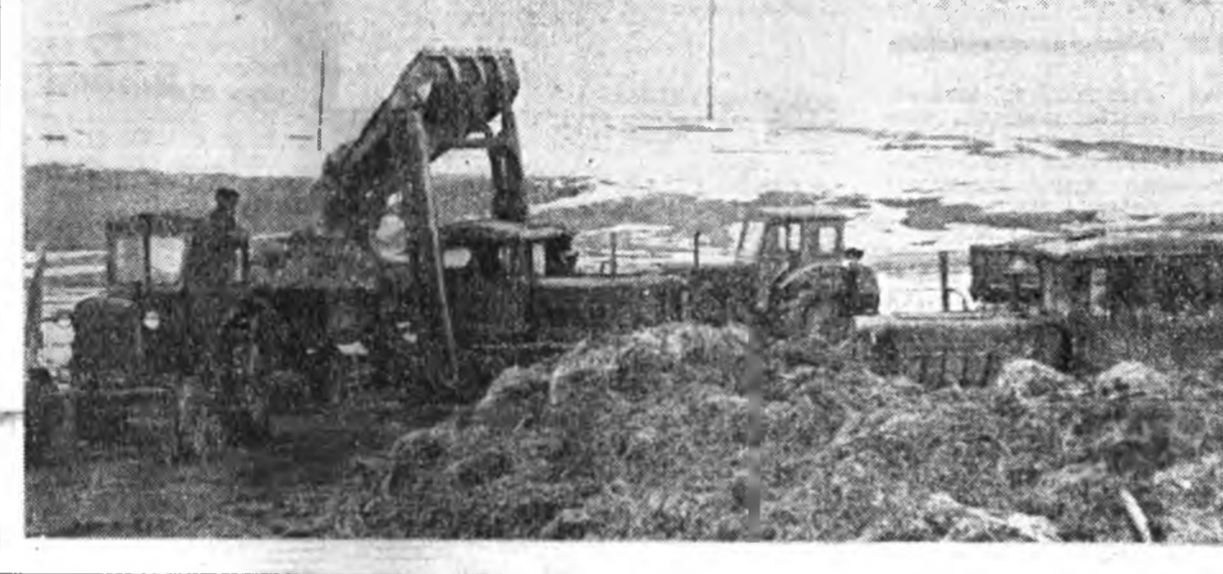
З. ВЕСНИНАГАЙ фототекст.

Сабшалангай ургаса найжаруулжа габшагай хоёр нарын түрүүшын табан хоной дунгууд гаргагдаба. Энэ дунгуудын найн байгаа гэжэ тэмдэглэлтэй. Оройдоол табан хоной турша соо сабшалан дээрэ 840 тонно наг шэбхэ гаргагдаба. Тэрэнэй 590 тоннонь отрядтай хүсөөр гаргагдахан байха юм. Тинхэдэ Булаг гэжэ газартай 10 гектар сабшаланда үтэгжүүлгэ хэгдээн, 1300 хэйгэ бургаг отологдоно бэлдэхэгдээ. Ушөө 3,5 километр утатой хорбо шэнээр баригдахан байна.