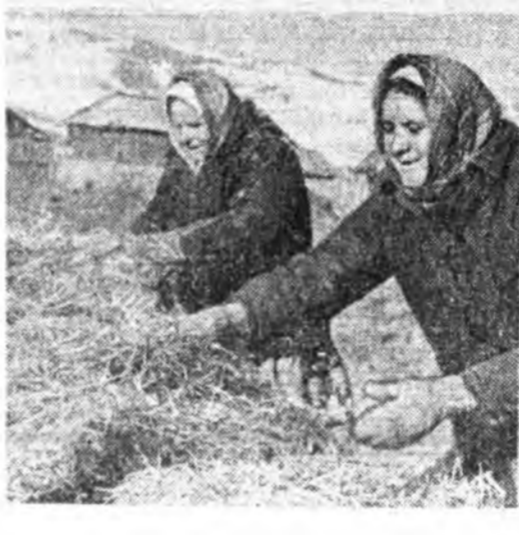
З. ВЕСНИНАГАЙ фототекст.

Овоц найнаар ургуулхын тула рассада саг соонь тариха, тэрэнээ зүбөөр харуулах гэжээ тон шухала гэжэ бүгэдэндэ мэдээжэ. Жэлнээ жэлдэ овоцтой баян ургаса абада Ленинэй нэрэмжэтэ колхозной огородшон мүнөө рассада тарихаар түлэг бэлдэжэ байхай.