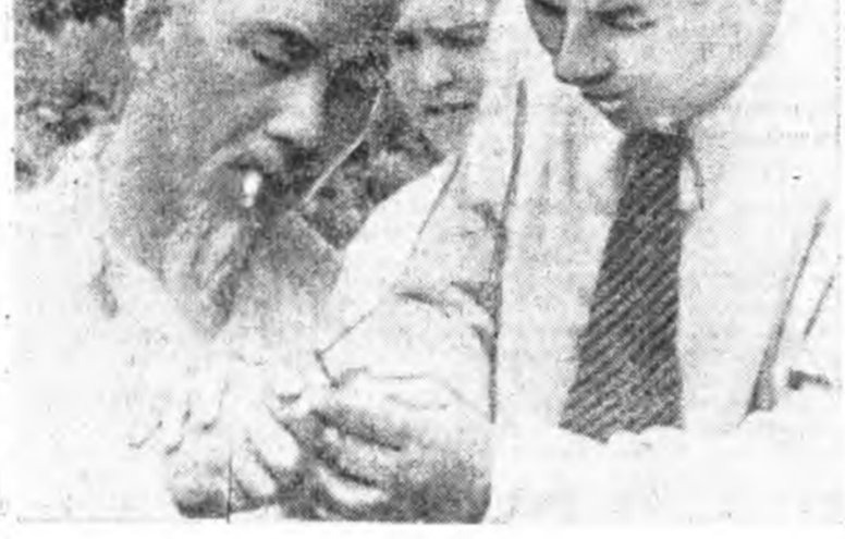
байһынь мэдэжэрхөд, ехэл хүнһэн юм. Тэдэнэр энэ модондо ержэ, бусадай жэшээгээр баһал тэрэ «тарилгана» хэлэн байна.

1957 ондо вьетнам арадай телеологшад Данг Хань Хой, Ту Танук, Нгуен Тьок Мау гэгшэд дэлхэйн олон яһатанай хүүбүүд, басагадай энэ модондо өөһэдынгөө мододой талаануудыг хуулагдаг