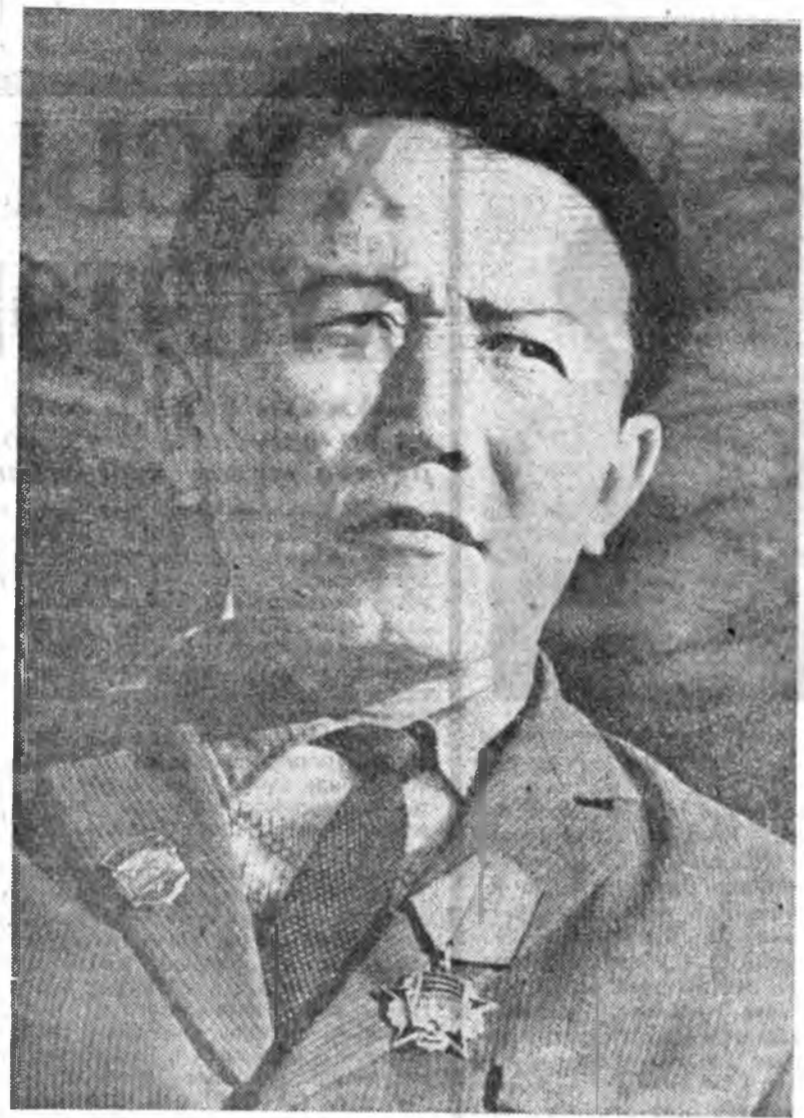
Улаан-Удын ЛВРЗ-эй дархашуулай цехэй тамгалагша-дархал...