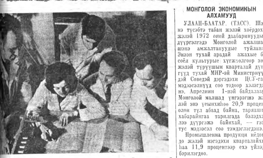
Болгарин эрдэмэй хүдэлмэрилдэд оронойгоо арадай түд хужээлтэдэ ехэ хэн хубитана оруулдаг байна. Экономикын шуухала асуудалууде тэдэнэр шидхэнэ. Науца бүхэ хүдэлмэринүүдэй 75 процентэй үйлдэбэрилдэг нэбтөрүүлэгдэнэ. ЗУРАГ ДЭЭРЭ: хэлхэе холбоной эрдэм-шэнжэлгын ял-дугай бүлэг хүдэлмэрилдэгшд. Тэдэнэр автоматическа теле-станицин нарийжуулагда ван проект бэлдэ.