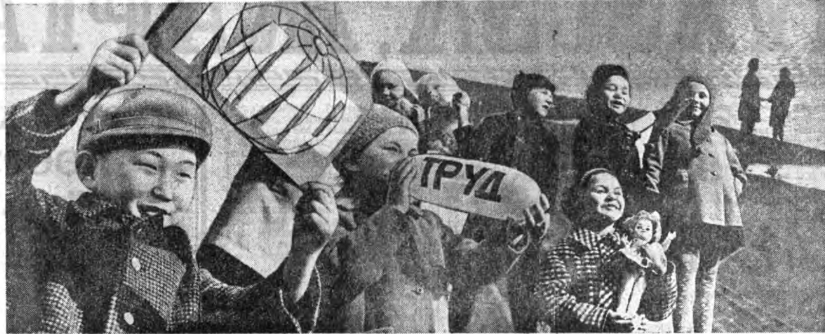
СОВЕТ ОРОНОН ЗОЛТОН УХИВУУД.

ДЭЛХЭЙН АРАДУУД: ЯДЕРНА БА ХИМИЧЭСКЭ ЭЛДЭБ ЯНЗЫН ЗЭВСЭГҮҮДЫЕ ХОРИХО ЭРИЛТЭ ТАБИГТЫ! ЗЭВСЭГҮҮДЫЕ БҮГЭДЭ НҮЙТЭЭРЭЭ, БҮРҮН ХҮРЯАХЫН ТҮЛЭӨ, УЛАСХООРОНДЫН АЮУЛГҮЙ БАЙДАЛ БЭХИЖҮҮЛХЫН ТҮЛӨӨ ТЭМСЭГТҮН (КПСС-ын ИК-гийн Урлагчууддаа).