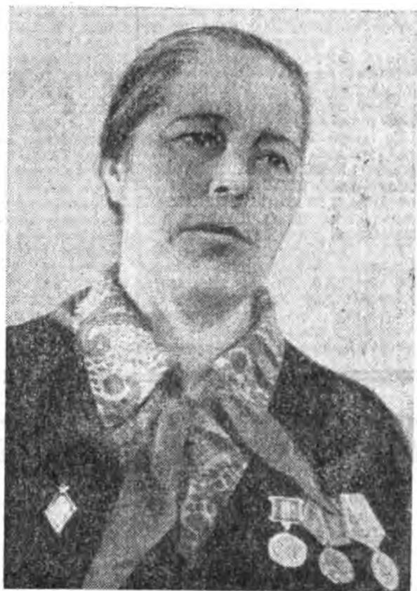
Ушад классай хурагшадые хабаадуудга...