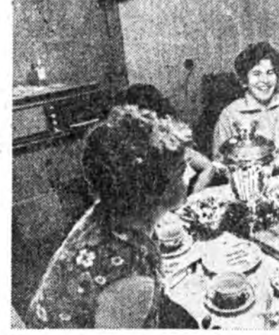
Галина буданай байдал; Галина будинтон наадаһа байна.

Республикын чемпионт байһан мастерта кандидат Самарин энэ мурьсөөндэ муса наадаһан байха юм.