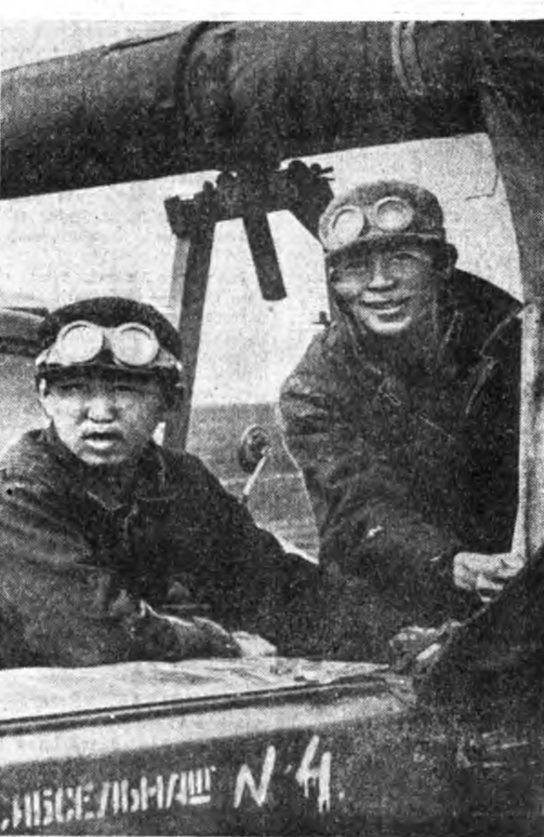
лаанайнганга даабари 120 процент дүүргэе. Саялжэнуудые ябажа шалгахад яһала һайн. Урһа хүрэнгэнэ бүхэдэ хорлогдохой.

Хабарай тарилга дээрэ хүдэлжэ байһан механизаторнуудта поли дээрэнь халуун эзэн асаргадана. Механизатор бүхэн социалис мүрсеөнэй дүрмтэй танилсахай.