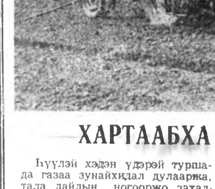
ХАРТААБХА ТАРИЛГА ДЭЭРЭ

Ойрын үдэрнүүдтэ кукуруза, обсо тариха эхил- хэмнэй. Мүнөө жэлдэ манай ажакы 500 гектарта кукуруза, обсо 500 гектарта тариха түсэбтэй. Механизаторнуудай обсоойнгоо хахалха ехьенэ таряд байна. Энээнэ дуунамсаараа кукуруза тариха захал- хабди.